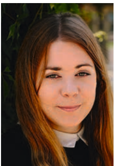
Stefanie Sargnagel