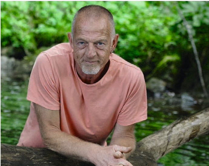
Gerbrand Bakker

Schon mit seinem Romandebüt »Oben ist es still« (2006) wurde der niederländische Schriftsteller Gerbrand Bakker international bekannt und mehrfach ausgezeichnet. Immer wieder lobt die Kritik seinen leisen, unaufgeregten Erzählstil, der auch seinen neuen Roman »Der Sohn des Friseurs« (Suhrkamp) auszeichnet. Gleichzeitig ist die höchst wendungsreiche Vater-Sohn-Geschichte aber auch von der ersten Seite an spannend, und das liegt nicht nur daran, dass sie von einer der schlimmsten Katastrophen der zivilen Luftfahrt erzählt.