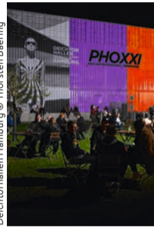
Deichtorhallen Hamburg © Thorsten Baering