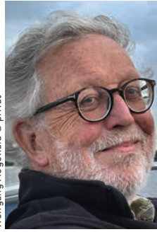
Wolfgang Hegewald © privat