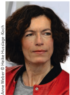
Anne Weber © Heike Husslage-Koch