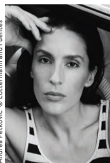
Andrea Petković