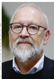
Herfried Münkler

→ Deutsches Schauspielhaus, Kirchenallee 39, 19.30 Uhr, € 18,-