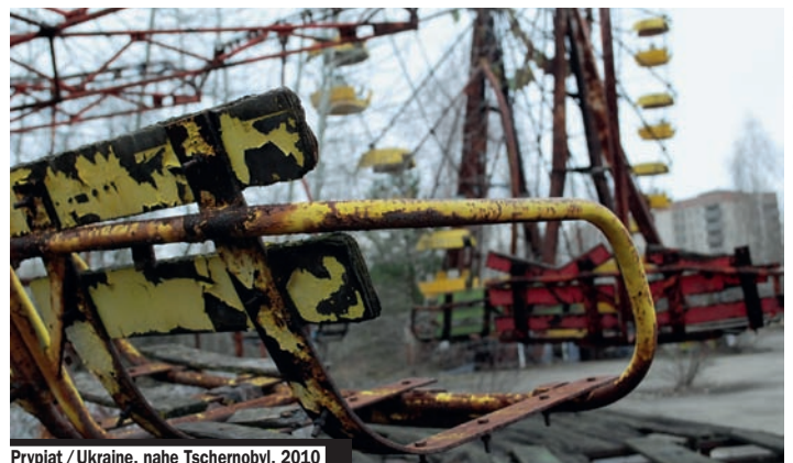
Prypjat / Ukraine, nahe Tschernobyl, 2010

Die Kulturbehörde der Freien und Hansestadt Hamburg vergibt auch in diesem Jahr wieder sechs Förderpreise für Literatur. Die Arbeitsstipendien sind mit je 6.000 Euro dotiert und werden ausschließlich an Autorinnen und Autoren vergeben, die in Hamburg oder im Gebiet des Hamburger Verkehrsverbundes ihren ersten Wohnsitz und Lebensmittelpunkt haben. Das Verfahren für die Vergabe der Förderpreise für Literatur ist anonym. Zusammen mit den Förderpreisen vergibt die Kulturbehörde Arbeitsstipendien für Hamburger Übersetzerinnen und Übersetzer. Die Fördersumme beträgt jeweils 2.500 Euro. Bewerbungen sind an die Kulturbehörde Hamburg, Literaturreferat, Hohe Bleichen 22, 20354 Hamburg, zu richten. Bewerbungsschluss ist der 12. August 2014 (Poststempel). Ausschreibungsbedingungen und Bewerbungsformulare liegen in der Zentralbücherei der Hamburger Öffentlichen Bücherhallen, Hühnerposten 1, im Literaturhaus, Schwanenwik 38, und in der Poststelle der Kulturbehörde, Hohe Bleichen 22, 3. Stock, Zimmer 310, täglich bis 15.00 Uhr, aus. Online findet man die Bewerbungsunterlagen unter www.literaturinhamburg.de und unter www.literaturpreise-hamburg.de .